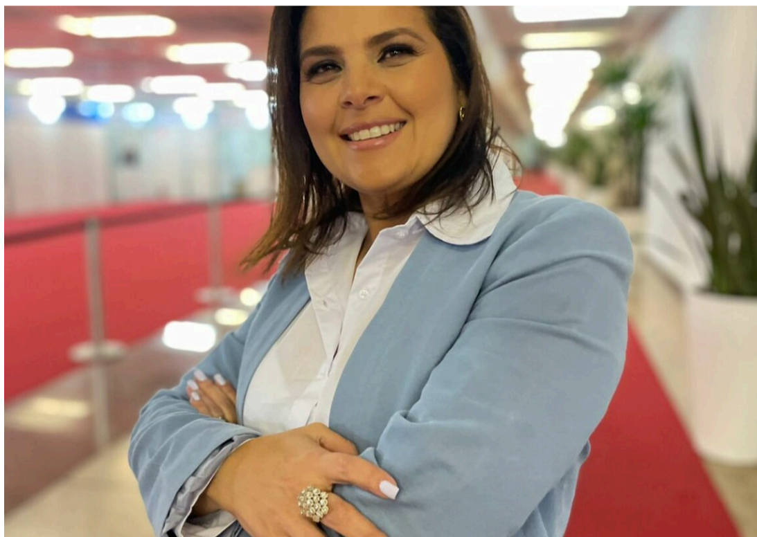
A empresária busca garantir a saúde e o bem-estar de pacientes em tratamentos de saúde delicados

A Make Life investiu até o momento R$ 5 milhões em estudo clínico e registro de patentes na área de proctologia, um ramo que tem muita demanda e que não existem muitos produtos para o segmento médico. A expectativa da empresa é fechar este com o faturamento de 1,5 milhão e faturar R$ 10 milhões em 2023, com o produto Hidranema, hidratante anal com uma nanotechnology a base de hialuronato de sódio, que é uma inovação no tratamento de doenças orificiais e oferece conforto aos pacientes oncológicos que tem ressecamento de mais de 60%, levando muitos casos a casos de dores intensas.