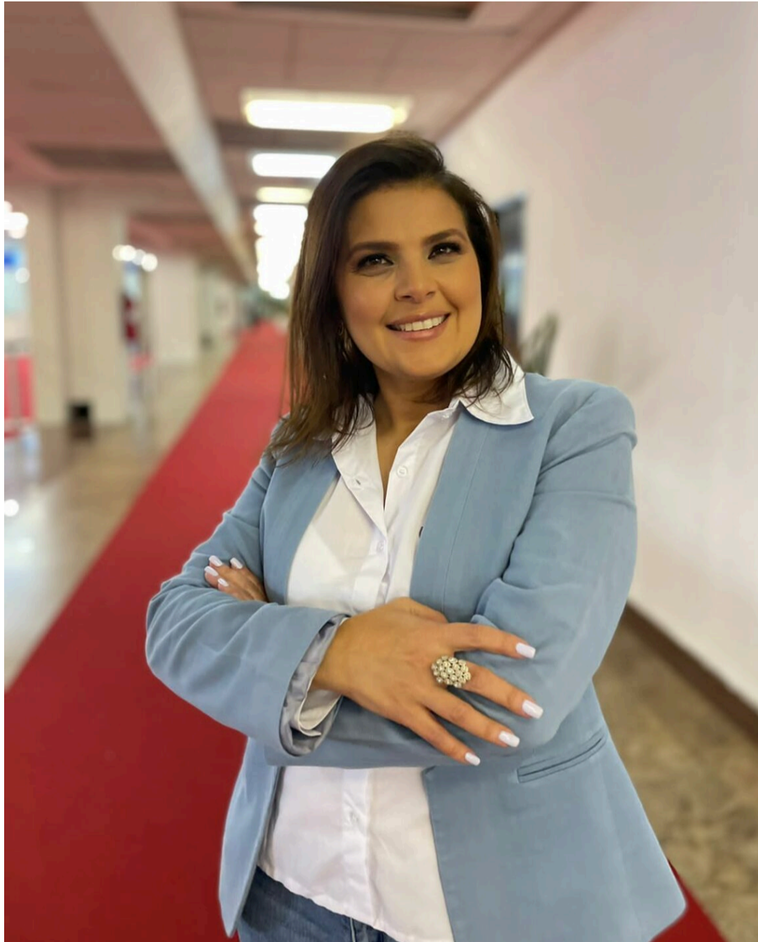
Farmacêutica criou uma rede de cuidados focada em áreas como ginecologia, oncologia, geriatria, gastrologia e proctologia

A empresária notou que o mercado estava carente de alguns produtos e por isso, em março de 2021, criou a Make Life, um braço da Makelab que é resultado de um trabalho minucioso de estudos e com sua vasta experiência de mais de 20 anos na pesquisa, criação e desenvolvimento de produtos para grandes empresas do país, decidiu empreender em um nicho de mercado pouco explorado, com intuito de proporcionar a prevenção doenças com uma linha inovadora com patentes requeridas.